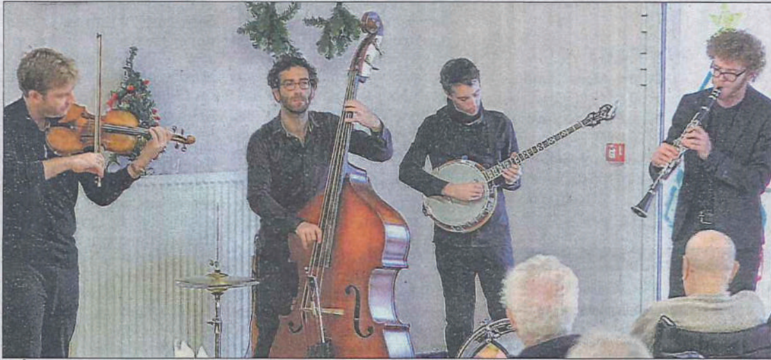
Maurice Klezmer est un groupe de quatre jeunes mélomanes joyeux.

Ce 1 er janvier, à l'Ehpad Les Gentianes, les résidents ont assisté à un concert musical du groupe Maurice Klezmer, composé de quatre musiciens (clarinette, violon, contrebasse