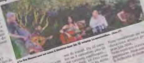
Le Trio Bassma lors d'un concert traditionnel, de l'histoire de l'amour et les mots de poésie arabe.

Le Trio Bassma est une formation lyonnaise de cinq musiciens par le monde arabe pour le 14e Festival du monde arabe. Le trio Bassma est une formation lyonnaise de cinq musiciens par le monde arabe pour le 14e Festival du monde arabe.