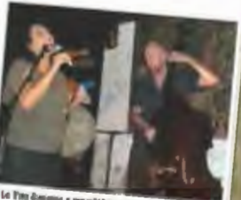
Le Trio Bassma a organisé le public.