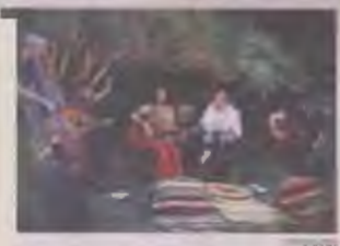
Les membres du Trio Bassma lors d'un concert traditionnel, de l'histoire de l'amour et les mots de poésie arabe.

UN ÉTÉ À BOURGES. Théâtre Jacques-Cœur. Blottis dans le velours italien, on se disait que c'est dommage, quand même, cette pluie au mois d'août. Quelques rayons de sourire suffirent à éclipser l'orage qui avait forcé le repli. Une chanteuse brune aux pieds nus et des musiciens aussi métissés qu'accordés traînaient pour tout bagage un luth, une guitare, une contrebasse et quelques percussions. En arabe, kabyle et français, Trio Bassma a tracé ses mots dans le sable musical pour dire l'amour du prochain, de l'eau quand il fait chaud, et de la vie qui revient. Décidément, on reprendrait bien des vacances pour s'envoler de l'autre côté de la Méditerranée. Ce soir, à 21 heures, concert de Gospel Dream à la cathédrale (gratuit).