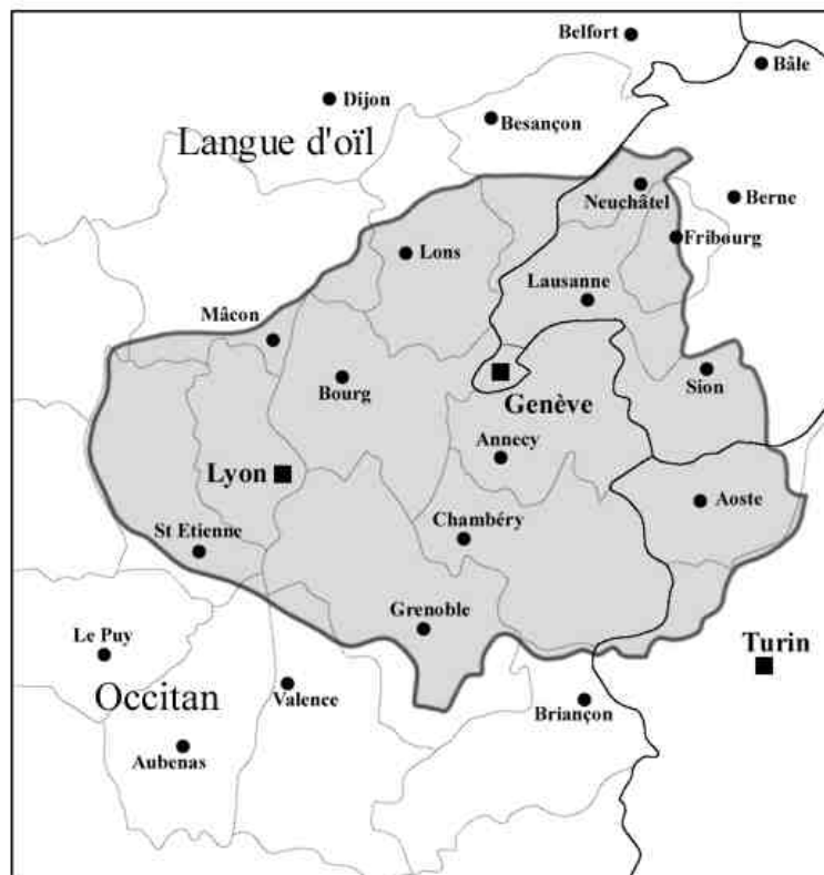
Le domaine francoprovençal