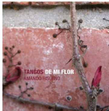
Tangos de mi Flor, 2013 Production : Nuevo Mundo Distribution : Nuevo Mundo