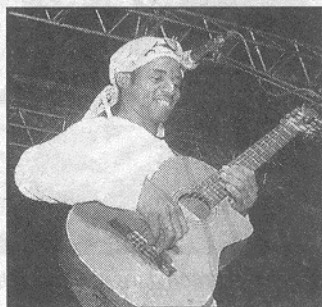
Le groupe Mundi colors animera la soirée au centre Jacques-Tati