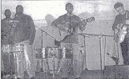
Le groupe Mundi Colors a animé la soirée

Au stade de l'Arceau, des footballeurs et des musiciens ont organisé une chaleureuse soirée au profit des Restos du cœur.