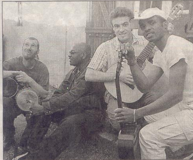
Aller simple et Mundi Color's se feront entendre samedi, parc du Jau.

turelle du centre Jean-Carmet. Se succéderont, de 19h à 1h : Aller simple (chanson française), Les Taupes (djembé), Nothing else (blues, rock, funk), Mundi Color's (afro-latino), Yvan Burger (rock), Maux Dera (rock).